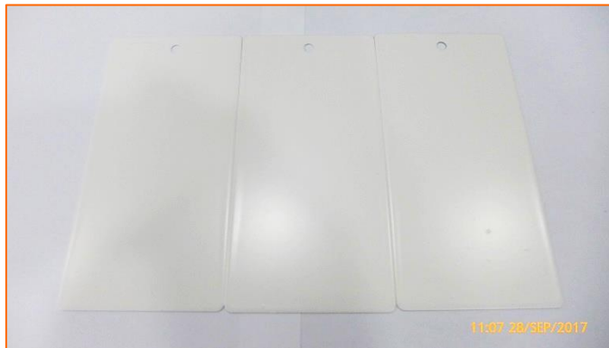
(a) Aspecto general del conjunto de muestras (estado de recepción en laboratorio).