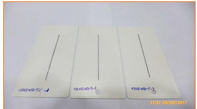
(b) Aspecto general del conjunto de muestras, una vez realizada la incisión sobre la cara pintada